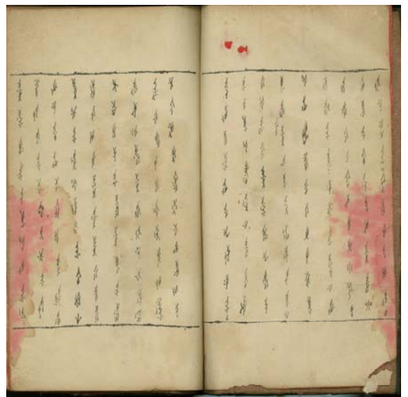
圖二：致賀婚禮的三朝書

除凸顯兩性觀點有別，女書也揭示中國婦女之間的階層差異，書寫與交誼網路的建立即是例證。當前對中國婦女書寫世界的瞭解，主要集中於明清仕紳閨閣，這些研究大抵肯定書寫對拓展婦女社交網絡的功能，然而女書卻提供了一個農村範例，促使我們重新省思婚姻和以文會友之間的辯證關係。在江永農村，女書可說是見證姊妹情誼的兩面刃。女書的書寫特性使得江永婦女得以跨越村里疆界，以書信結拜姊妹，建立「三從」之外的社會網絡，創造娘家和夫家以外的另一個社交空間或避風港，「結交三年成骨肉，只靠姊妹開我心。久久坐齊同細說，告訴姊妹疼惜聲」。但矛盾的是，女書在催生姊妹關係的同時，又冷酷地宣告婚姻生活對維繫姊妹情誼的牽制力。也所以在祝賀結拜姊妹結婚的三朝書中，婦女一方面期勉彼此：