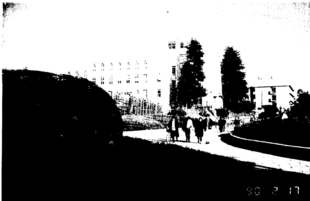
阪大是大阪府內唯一的國立綜合大學。